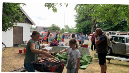
Bakluckeloppis i Rickarum.