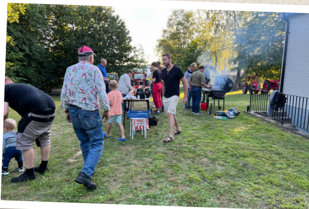
Traktorkafe i Nävlinge.