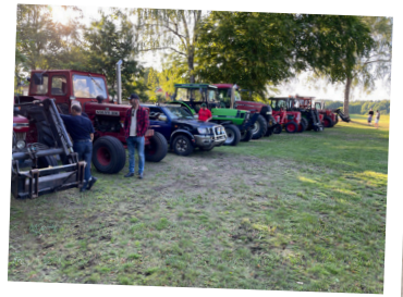
Traktorkafe i Nävlinge.