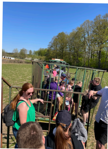
Familiescout åker balvagn.