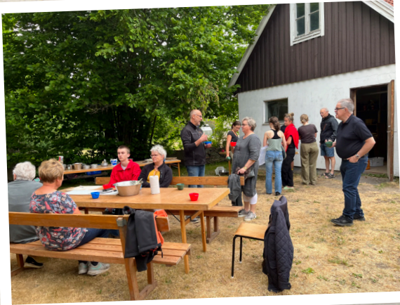
Pizzakväll i Rickarum.