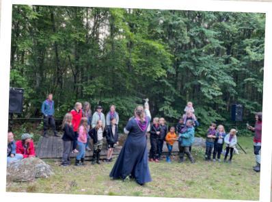
Prisutdelning på scoutlägret.