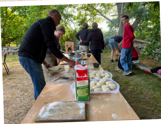
Pizzakväll i Rickarum.