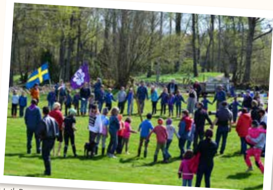
Hajk Bosarp 3 maj.