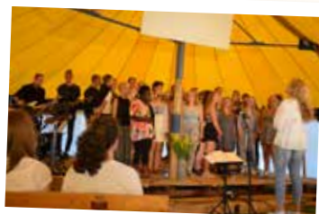
Skärgårdsläget Olsängsgården 11–19 juli.