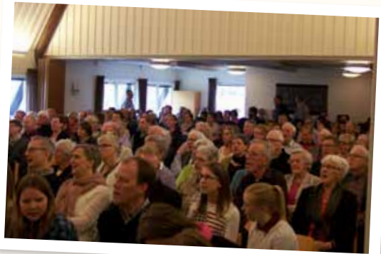
Församlingsdag på Åhusgården den 26 april.