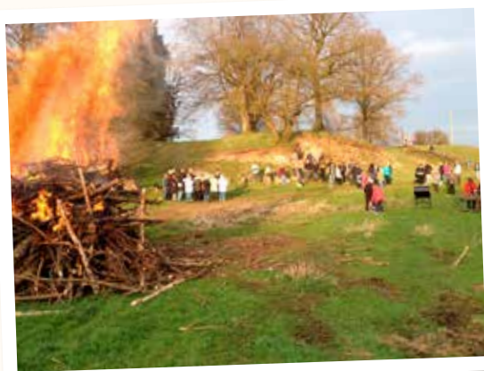
12 Vårbrasa Nävlinge, 24 april.