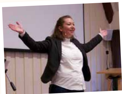
Församlingsdag på Åhusgården den 26 april.