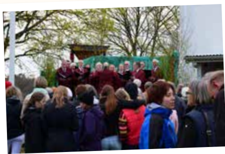
Manskören sjunger in våren på skolgården 1 maj.