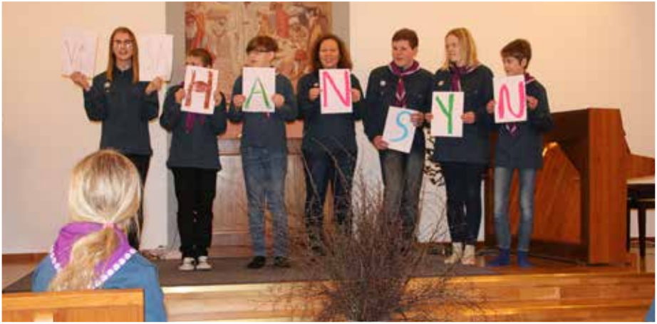
Dramatisering av scoutlagen på scoutinvigningen i Nävlinge 29 mars.