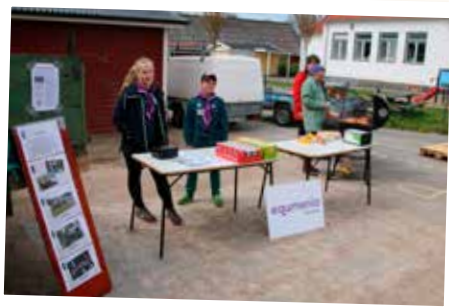
Scouterna från Egemenia Nävlinge säljer korv på Modellgänget Skånes utställning i Linderöd.