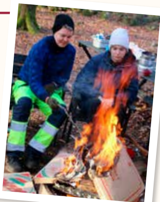
Pizza- och filmhäjk vid kyrkans skog i Brostorp.