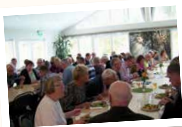
Församlingsdag på Åhusgården den 26 april.