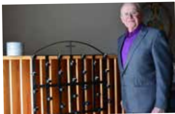
Invigning av ljusbäraren i Rickarum. Tillverkad av Gunnar Persson.