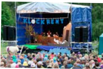
Klockrent - Drama vid stora scenen.