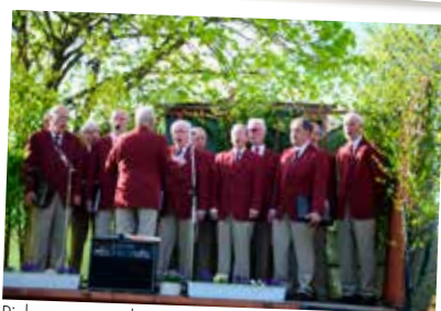
Rickarums manskör sjunger in våren den 1 maj.