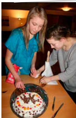
Tårttävlning på Frekvent.