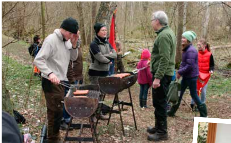
Korvgrillning på Kämpaleken vid vindskyddet den 5 april.