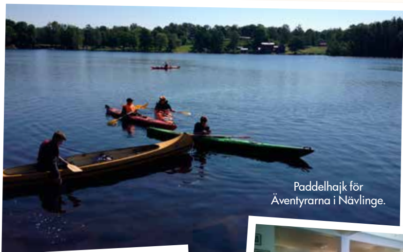
Paddelhajk för Äventyrarna i Nävlinge.