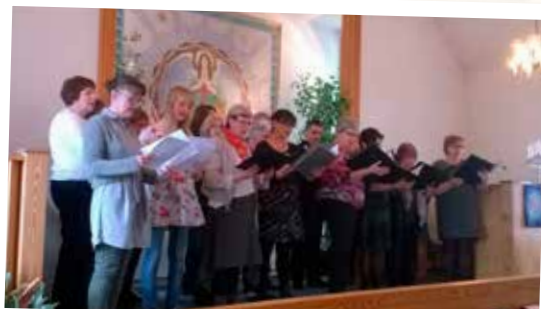
Ekumenisk gudstjänst med Äsphults och Linderöds kyrkokör den 16 mars.