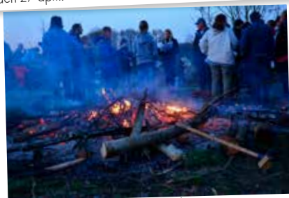
Vårbrasa i Harastorp den 25 april.