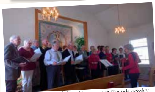
Ekumenisk gudstjänst med Kören Stämning och Djurröds kyrkokör den 27 april.