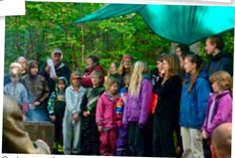
Gudstjänst vid scoutplatsen den 11 maj.