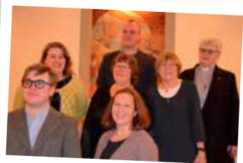
28/2 Nävlinge Missionskyrka 50 år. Tidigare och nuvarande anställda.