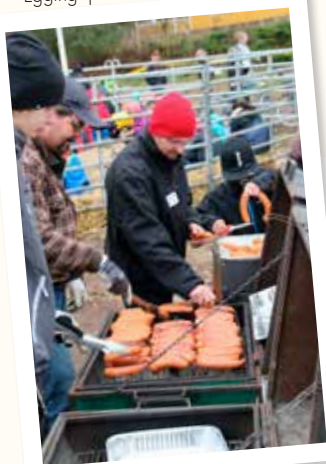
15/11 Scouterna grillade korv på traktorracet i Nävlinge.