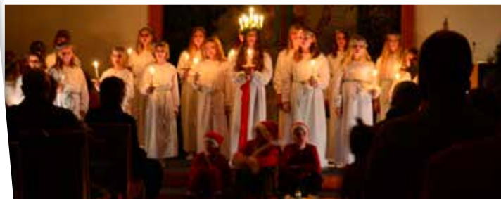
Nävlinges och Rickarums gemensamma luciatåg.