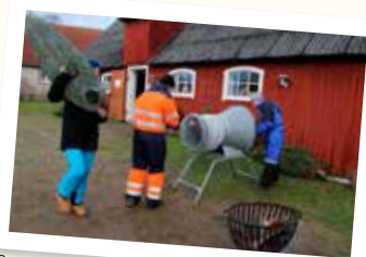
Scouternas julgransförsäljning på Humlalyckan.