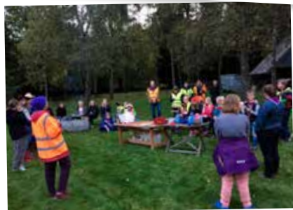
Scouter från Nävlinge och Rickarum avslutade en kväll för miljön i Axelboda.