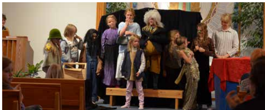
Teatergruppen från Äsphult medverkar i Rickarums Missionskyrka.