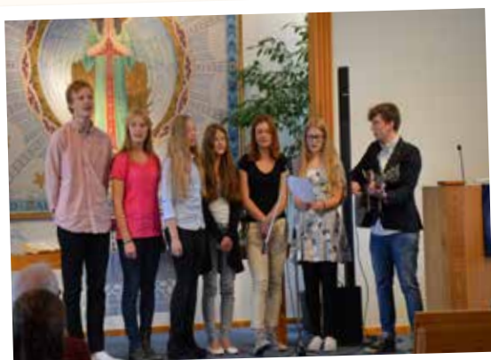
Sång av ungdomar.