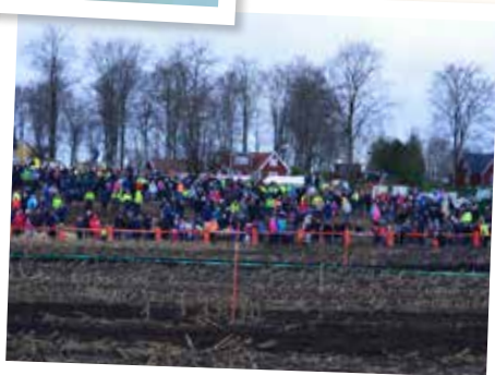
Traktorrace i Nävlinge.