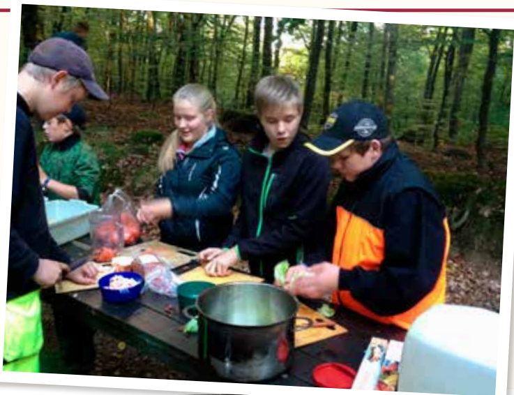
Nävlingescouter lagar mat på hajk vid kyrkans skog.