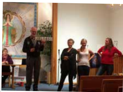
Försäljning i Rickarum.