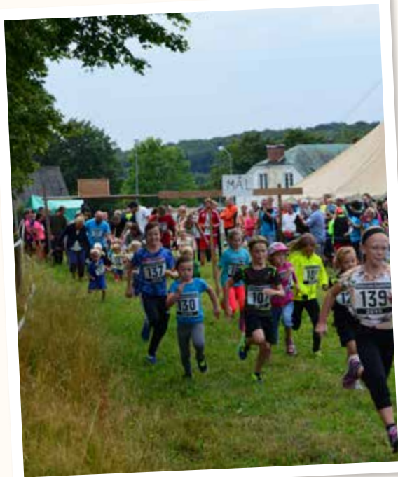
Barnloppet på Byastafetten